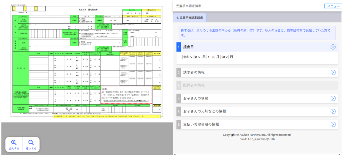
申請サポートプラス画面イメージ (パソコンでの表示イメージ)