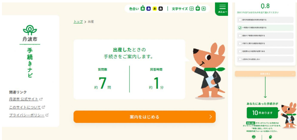
<手続きナビ画面イメージ>

また、『手続きナビ』には、通常の機能である手続き案内や申請フォームへのリンクに加え、一部の申請ではガバメイツとの連携によるマイナンバーカードを活用した住民情報が自動転記され、オンラインによる申請が可能となります。このような一連の作業により、手続きの手間を削減し、「住民利便性の向上」と「業務の効率化」の実現を目指します。