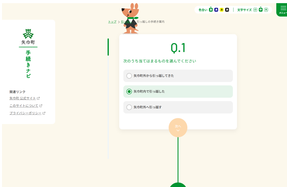
<ナビゲーション画面>

「手続きナビ」では、住民がいくつかの質問に回答するだけで、住民それぞれの状況に応じて必要な手続きや持ち物、手続き場所等を確認することができます。また、担当課が異なる手続きを横断的かつ網羅的に知ることができるので、申請漏れや手戻りの心配なく手続きの準備を整えることができます。