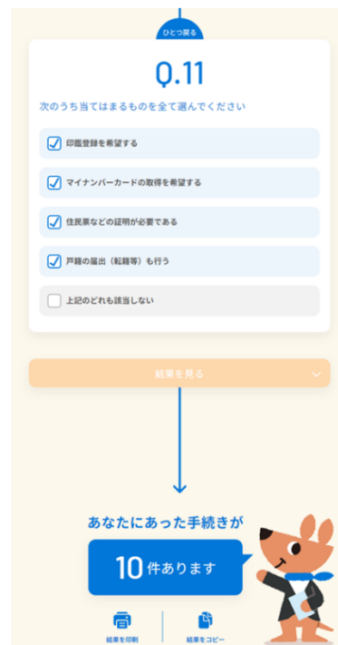
手続ナビ画面イメージ